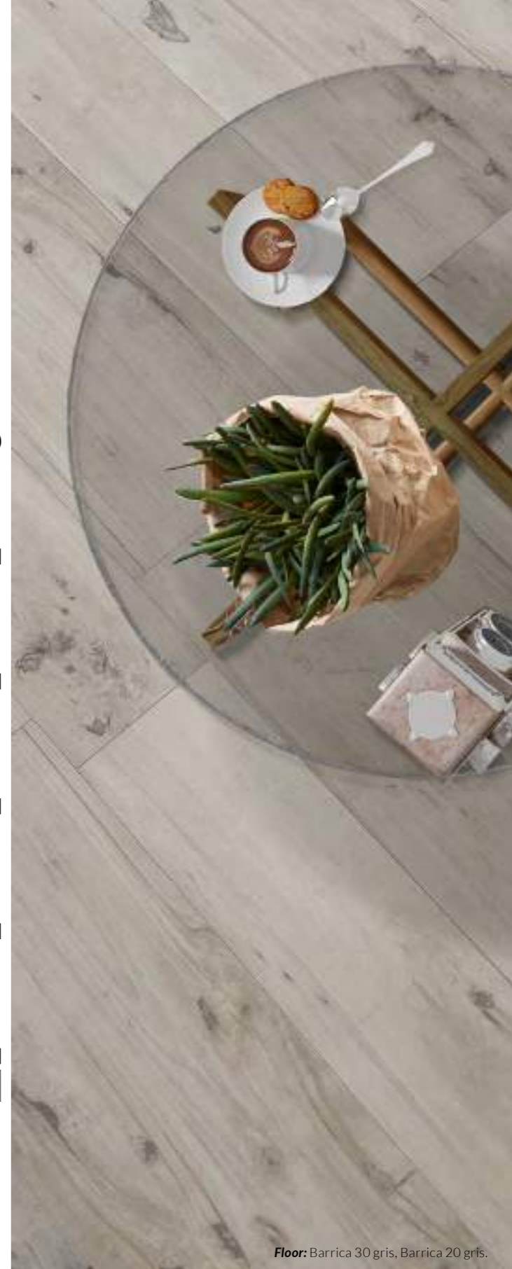
Floor: Barrica 30 gris, Barrica 20 gris.