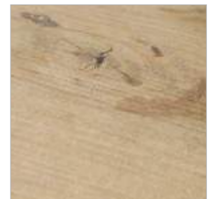
DRY | ANTIDESLIZANTE · SLIP RESISTANCE