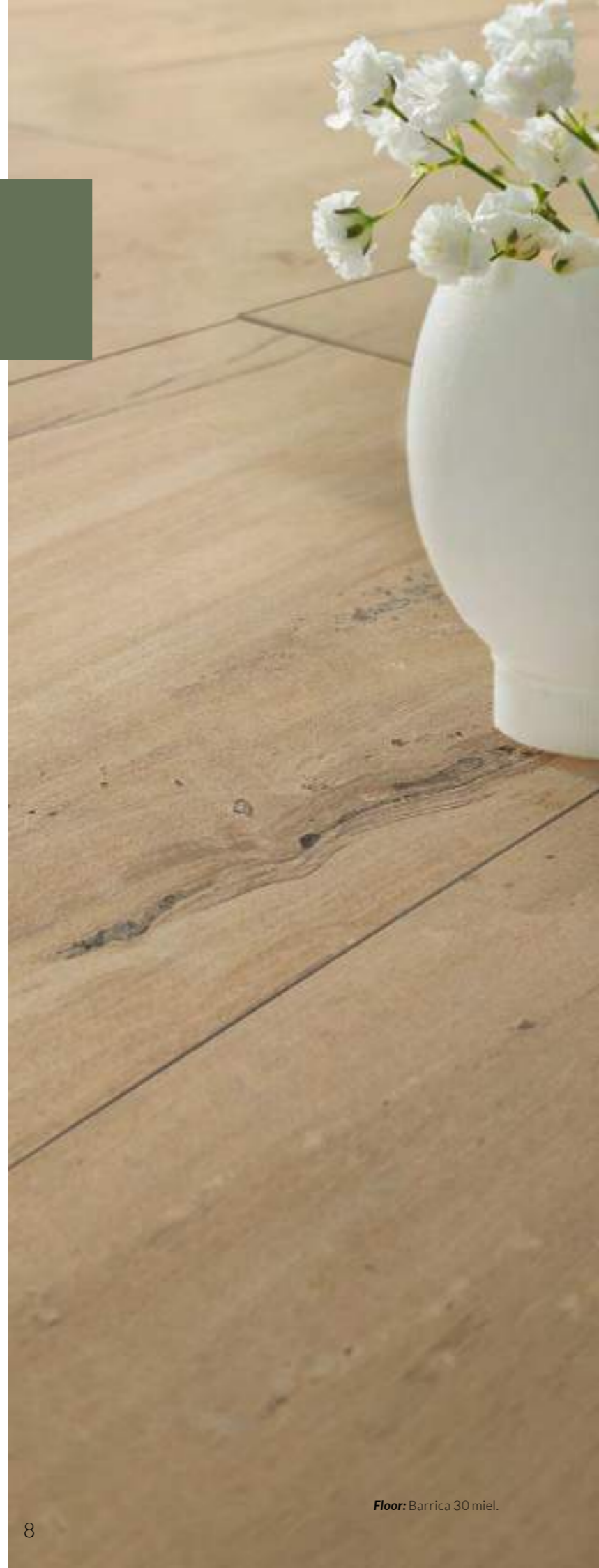
Floor: Barrica 30 miel.